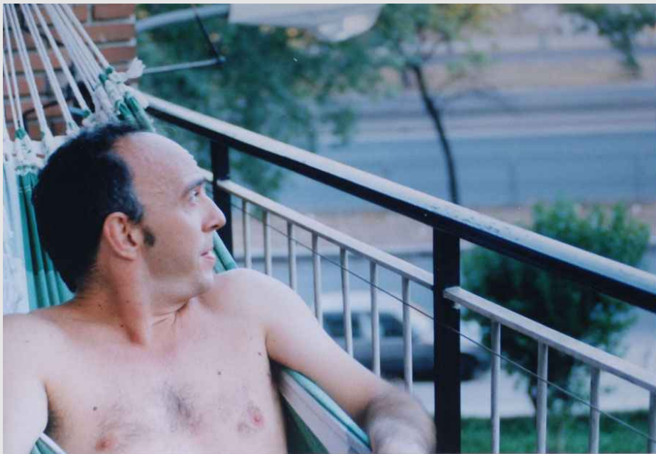
El artista durante los preparativos del trabajo.